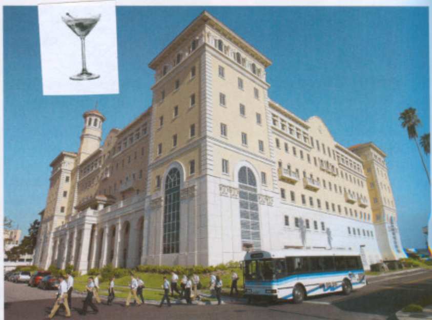
QUARTIER GENERALE È a Clearwater, in Florida, un'intera città comprata da Scientology. In questo palazzo verrebbero addestrati uomini dai "super poteri".