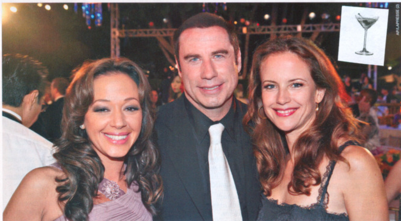
JOHN TRAVOLTA Pare che nel 2009 volesse lasciare Scientology, sconvolto dalla morte del figlio Jett, 16 anni: gli scientologist lo avevano spinto a sospendere gli antiepilettici al figlio, considerati inutili. A destra la moglie Kelly Preston, scientologist convinta.

L'obiettivo è riempire le loro statistiche: ogni settimana i membri dello staff devono compilare un modulo da mandare negli Usa con le entrate: poi ho scoperto che i soldi vengono usati per portare in tribunale gli oppositori. Il problema non sono le persone, ma la dottrina: ne esiste